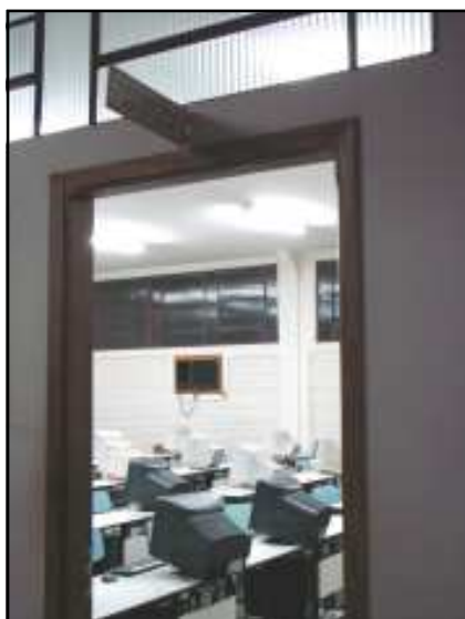
Laboratório de Línguas