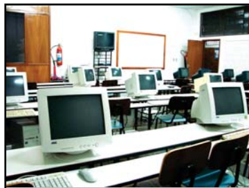
Laboratório de Línguas

LABORATÓRIOS: As FIPAR contam com amplos e modernos laboratórios equipados com computadores potentes para os cursos e também com um dos melhores laboratórios para o aprendizado de línguas de toda a região.